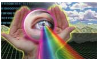
Alle wegen leiden naar uw droomjob

De KISS-sollicitantenbank is voor veel werkgevers een extra werfreserve. Zet daarom zelf de eerste stap naar bedrijven die op zoek zijn naar personeel.