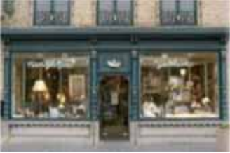
Uw eigen zaak